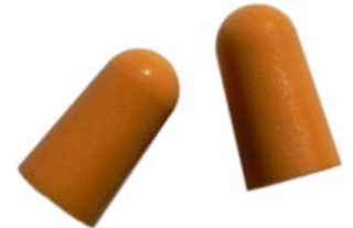
Klassischer Gehörschutz: Formbarer Ohrschutzstöpsel

Wofür man sich letztlich entscheidet, ist jedem selbst überlassen. Generell gilt zu bedenken, dass insbesondere hinsichtlich des Tragekomforts jeder anders empfindet. Von daher sollten Sie möglichst viele verschiedene Gehörschützer ausprobieren.