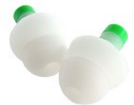
Klassischer Gehörschutz: Fertig geformter Ohrschutzstöpsel