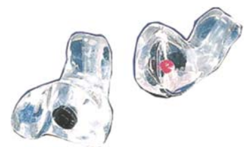
Exklusiverer Gehörschutz: Individuelle Anfertigung